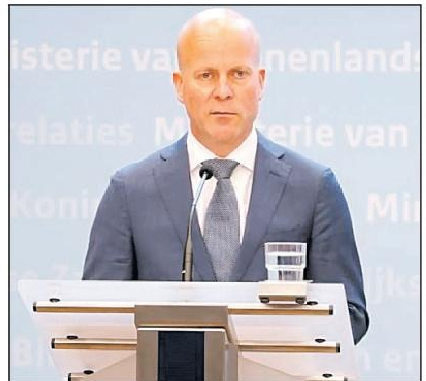
unda tabata kier pa di "take it or leave it". 'teken bij het kruisje', of

Por tuma nota si, cu tur isla ta dispuesto pa haci cambio, bini cu reforme y cumpli cu condicionan di Hulanda, pero ta bay pa e forma di proceder